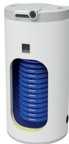
OKC 160 NTR/HV