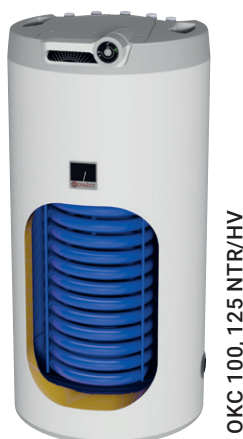
OKC 100, 125 NTR/HV