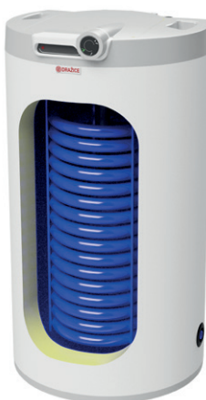
OKC 100.1, 125.1 NTR/HV